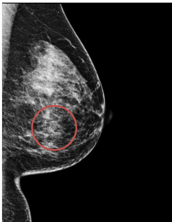
通常のマンモグラフィ画像での腫瘍