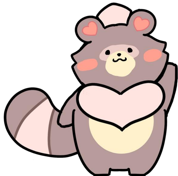
公立甲賀病院公式キャラクター もふぽんぽん